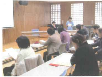
12月6日地域支援員説明会

5月10日、12月6日の2回地域支援員説明会と随時募集により年間20名が地域支援員に登録しました。