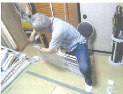
ゲージの組み立て