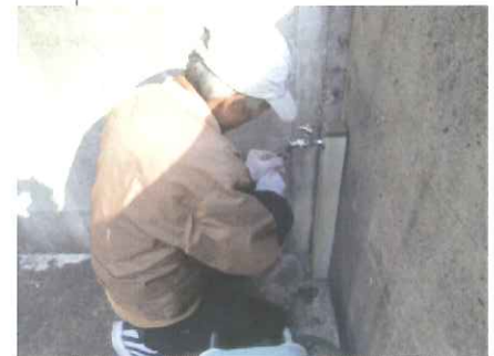
蛇口ホースの取りはずし

ちょっとした困りごとの支援の様子を集めました。長年しまってあった衣類の整理や木製のプランターを片付けるなど同じ姿勢で長時間作業することが出来ない、また工具を使っての作業ができないとご相談があり、支援活動をお願いしました。