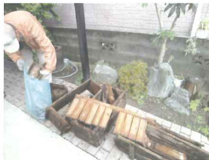
木製プランター解体